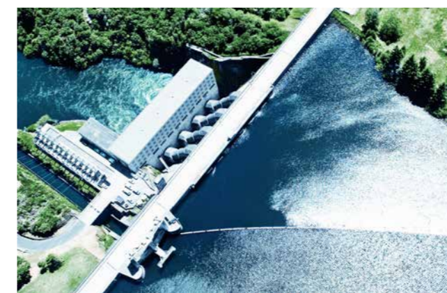
SERVICE & REHAB